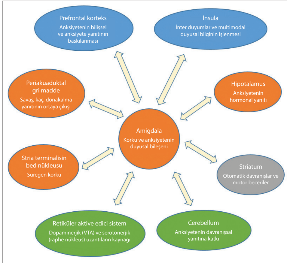
Şekil 2. Korku oluşumu ve sönmesinde devreye giren nöroanatomik yapılar ve anksiyete yanıtına katkıları. Mavi renk kortikal bölgeler, turuncu renk limbik sistem yapıları, gri renk bazal ganglia yapıları, yeşil renk beyin sapındaki bölgeleri ayırt etmek için kullanılmıştır (Dönmez, 2019'dan alınmıştır).

Tekrar konsolidasyon ( reconsolidation ) belleğin destabilizasyonu ile başlayan, protein sentezinin gerçekleştiği tekrar stabil hale getirme ( restabilizasyon ) fazıyla devam eden, belleğin labil bir duruma getirilip farklı bir formda depolanabilecek hale gelmesi sürecidir (Nader, Schafe ve LeDeux, 2000; Przybyslawski ve Sara, 1997). CS'un sunulmasını takip eden ilk 6 saatte bir rekonsolidasyon penceresi açılmış olur (Nader, Schafe ve LeDeux, 2000) ve bu dönemde bellek yenilenebilir (Marks ve Zoellner, 2014).